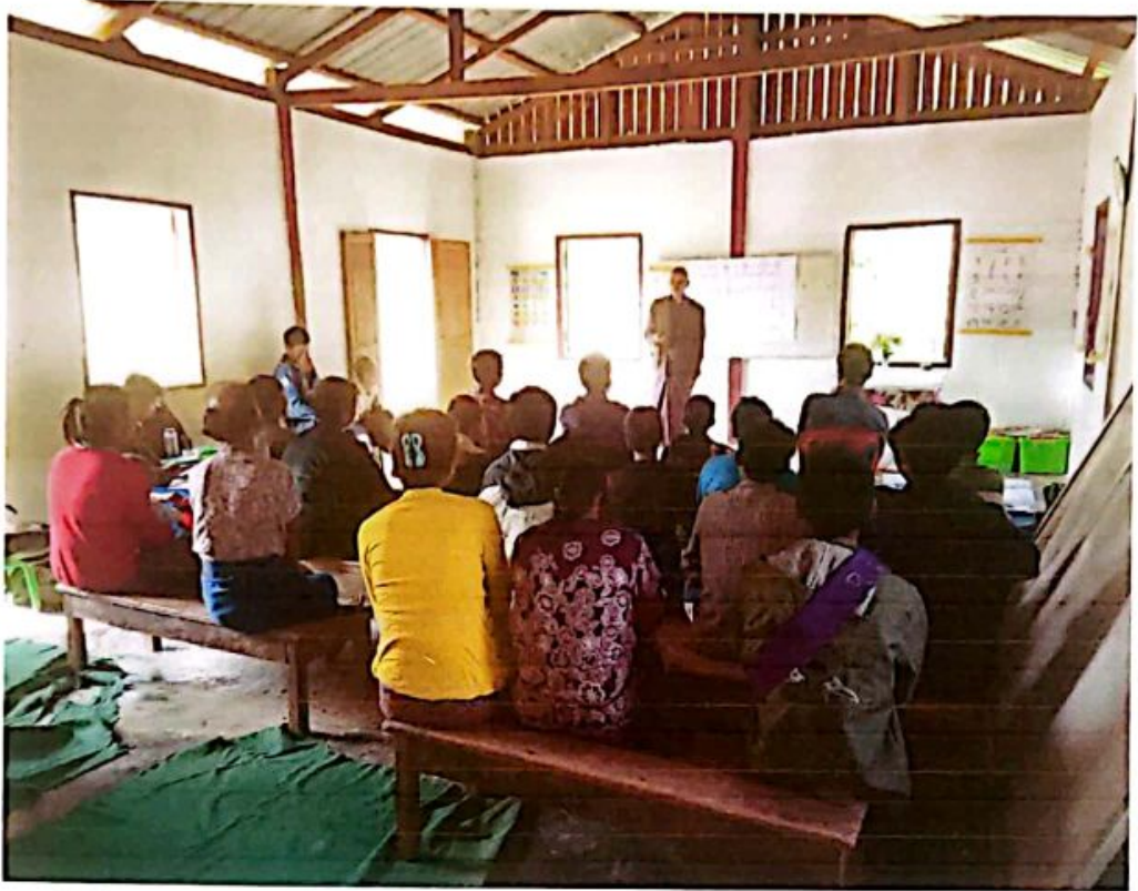
ကြွေသောင်ကျေးရွာပထမအကြိမ်စီမံကိန်းမိတ်ဆက်အစည်းဝေးမှတ်တမ်း