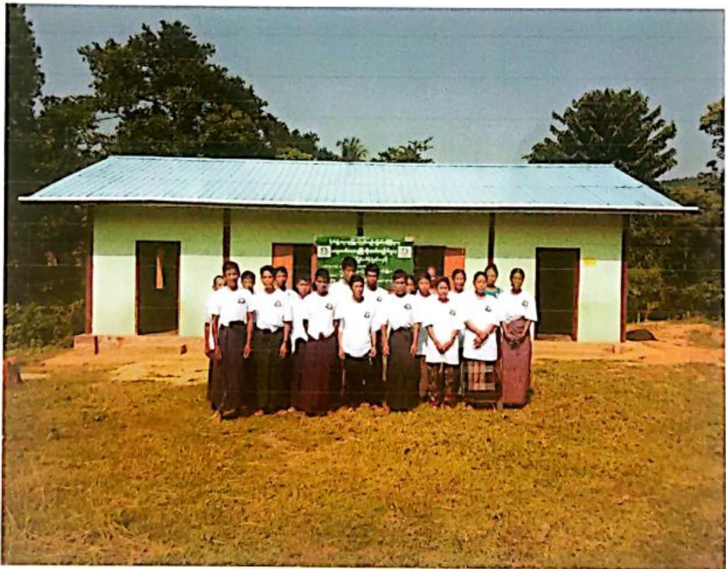
ကြွေသောင်ကျေးရွာ စီမံကိန်းလုပ်ငန်းခွဲရွေးချယ်အစည်းဝေးမှတ်တမ်း